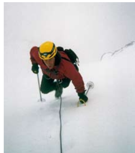
Sul Gran Zebrù nel gruppo Ortles-Cevedale a 3856 m, il 20 agosto 2006. Una delle vie normali più difficili.

Qualche uscita in montagna, tempo permettendo, e salute permettendo, spero di farla ancora, poi mi allenerò per lo sci nordico, per partecipare ai campionati italiani di categoria.